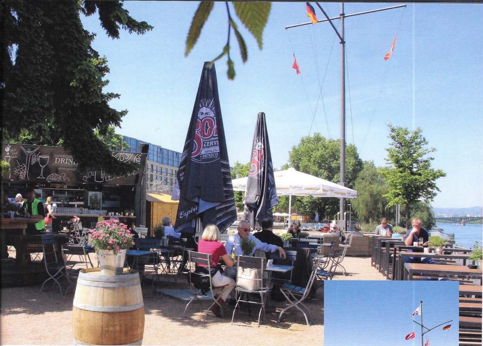
Entspannte Atmosphäre, kühle Getränke und kreative Gaumenfreuden – wer den Sommer am Rhein genießen möchte, ist im Biergarten auf der Mole genau richtig.

chem Biergarten und stylischer Lounge mit Sesseln und Liegen ist äußerst gelungen. Ebenso wie das Angebot an Getränken und Speisen. Wer das kulinarische Angebot genauer unter die Lupe nimmt, findet Klassiker wie Spundekäs' und herzhafte Bratwürste genauso wie modern interpretierte Klassiker, zum Beispiel der „Rhoihesse Burger“ mit gegrillter Fleischwurst im Laugenbrötchen – alles lecker, alles frisch, alles eben von echten Gastro-Profis gemacht. Es gibt hausgemachte Limonade und aus den Boxen schallt ruhiger Sound im Stil des legendären Café del Mar. Die tolle Lage direkt am Rheinufer tut ihr Übriges dazu, man fühlt sich schnell ein bisschen wie im Urlaub.