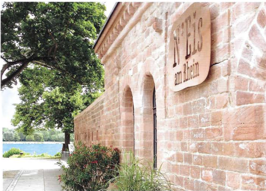
Die neue N'Eis-Filiale eröffnete am 1. Mai im alten Wehrhäuschen an der Malakoff-Terrasse. Seitdem versorgt das Team von N'Eis die Kunden mit täglich wechselnden Eiskreationen.

Das großzügige und beliebte Winterhafen-Areal wird weiter aufgewertet. Gauls Catering hat den Mole-Biergarten übernommen und N'Eis, bisher nur in der Neustadt mit ihren Eiskreationen vertreten, eine Filiale in unmittelbarer Nähe eröffnet. Beide Projekte wurden mit Unterstützung der Mainzer Volksbank realisiert und versprechen mit ihrem hochwertigen Angebot einen tollen Sommer direkt am Rhein.